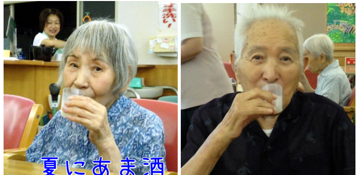
夏にあま酒 いえいえ夏こそあま酒

酒粕ではなく、麴で作る甘酒に含まれる糖は砂糖ではなく、体内で分解しないブドウ糖なのです。ですから、飲んですぐに腸内の善玉菌を助け、効率よくエネルギー源として吸収されます。ブドウ糖以外にもアミノ酸、ビタミンB群、ミネラルなどが豊富に含まれています。この成分は疲労回復の点滴と同じなんです。ですから、 熱中症対策と夏バテ防止の飲み物として 、デイサービスで飲んでいただきました。昔の人はそのことを十分理解して甘酒を夏に飲んでいたのでね。最近は缶に入ったものや粉末など便利なものが出ていますので、ご家庭でのお飲み物に取り入れていただけるといいですね。